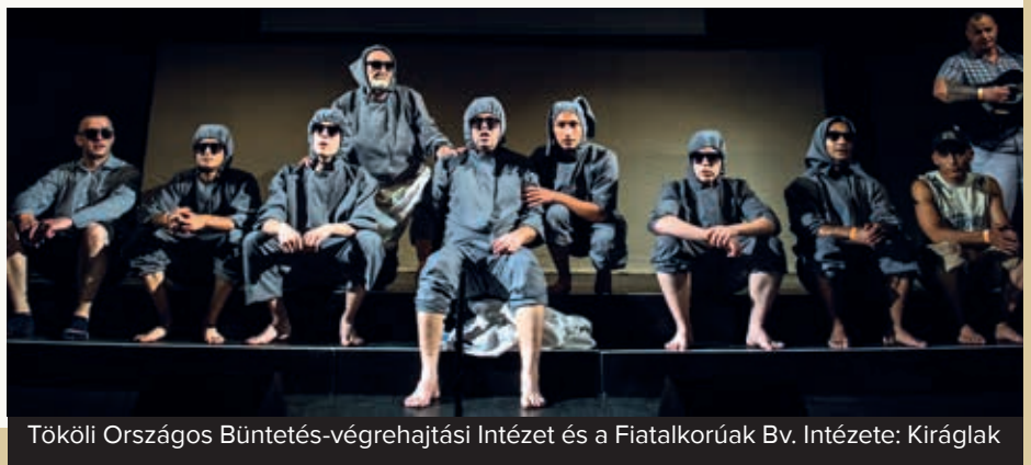
Tököli Országos Büntetés-végrehajtási Intézet és a Fiatalkorúak Bv. Intézete: Kiráglak