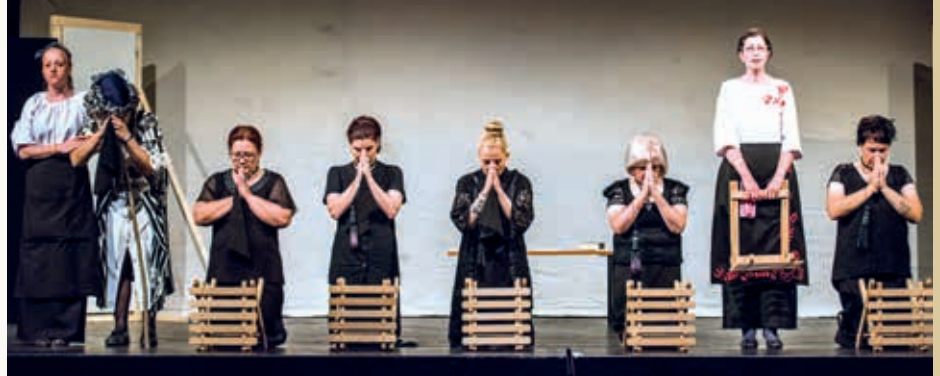
Pálhalmi Országos Büntetés-végrehajtási Intézet: Frederico García Lorca Bernarda Alba háza

Elvis Presley Jailhouse rock című slágerére húzzák fel a függönyt, a veszprémi börtön színjátszói kezdenek. A színpadon székek és egy kanapé. Két férfi beszélget. Cégvezetők, akiknek a vállalkozása anyagi gondokkal küszködik. Egy megoldás maradt csupán: a cégnek meg kell nősiennie. Végül felsejlik Ledermann és az a bizonyos tűzép is, ahová Kemény úr és Barna úr se akar visszamenni culágernek. Hát házasságra adják a fejüket. A humoros kezdést követően a tököli intézetek színjátszói majdnem teljesen süket és vak földikutyaként lépnek a színpadra. A bonyodalmak Rómeó születésével kezdődnek. A Pixis családba érkező új jövevénynek ugyanis hosszú füle van és lát. A családfo hozzáállása le-sújtó, véleménye szerint soha sen-