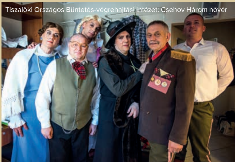
Tiszalöki Országos Büntetés-végrehajtási Intézet: Csehov Három nővér