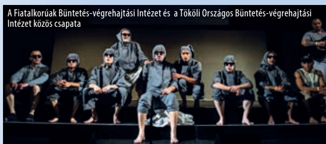
A Fiatalokéak Büntetés-végrehajtási Intézet és a Tököli Országos Büntetés-végrehajtási Intézet közös csapata