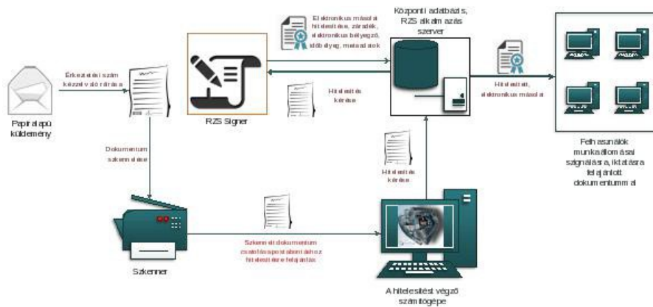
1. ábra: Papíralapú iratról hiteles elektronikus másolat készítésének rendszerszintű feldolgozási folyamata

Az elektronikus aláírás, a metaadatrendszer elektronikus példányra történő bekerülésének biztonságát a szerver oldali feldolgozás biztosítja.