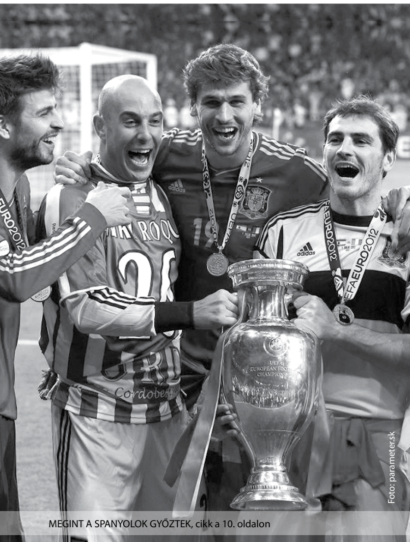
MEGINT A SPANYOLOK GYŐZTEK, cikk a 10. oldalon